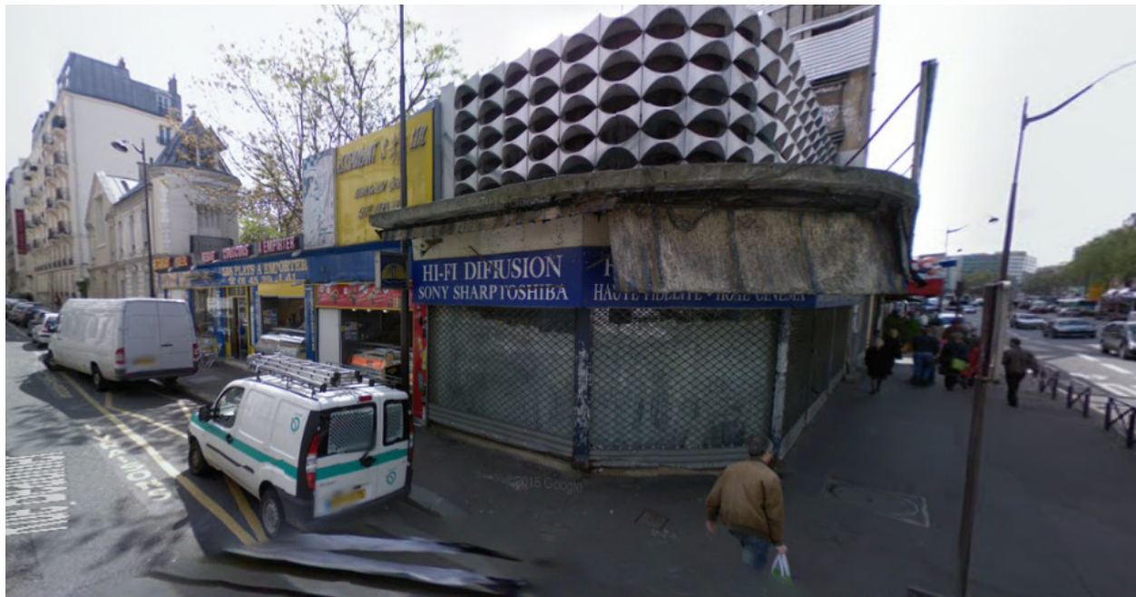
Rue Beaunier, Paris (2008)