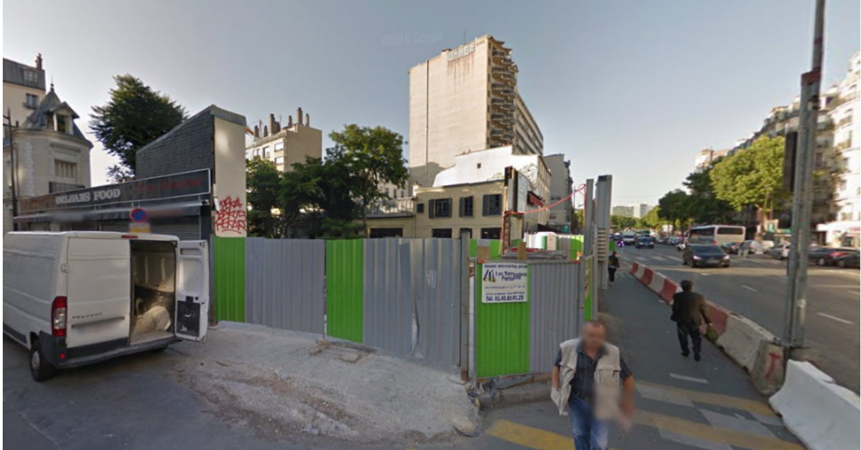
Rue Beaunier, Paris (2015)